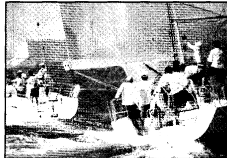
Αναζητεί καλύτερη εμφάνιση το ELLINIX (δεξιά), το οποίο εδώ κυνηγά το PETRA