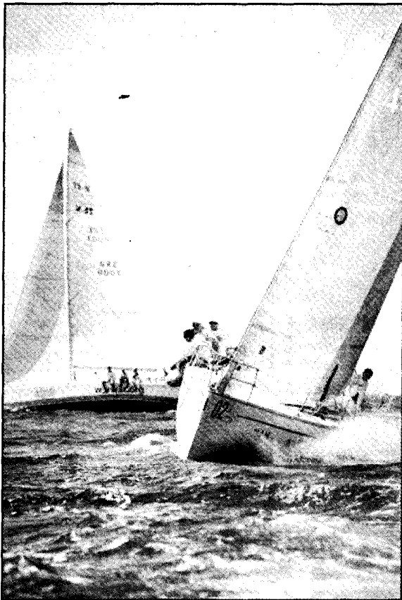
Οι περσικοί πρωταθλητές (IMS) Βούλγαροι του "PETRA" προς το παρών κάνουν αξιολογή εμφάνιση