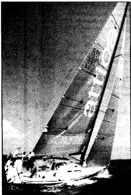
Το JINETERA κέρδισε στον μικρό αγώνα και μπήκε στο παιχνίδι του τίτλου