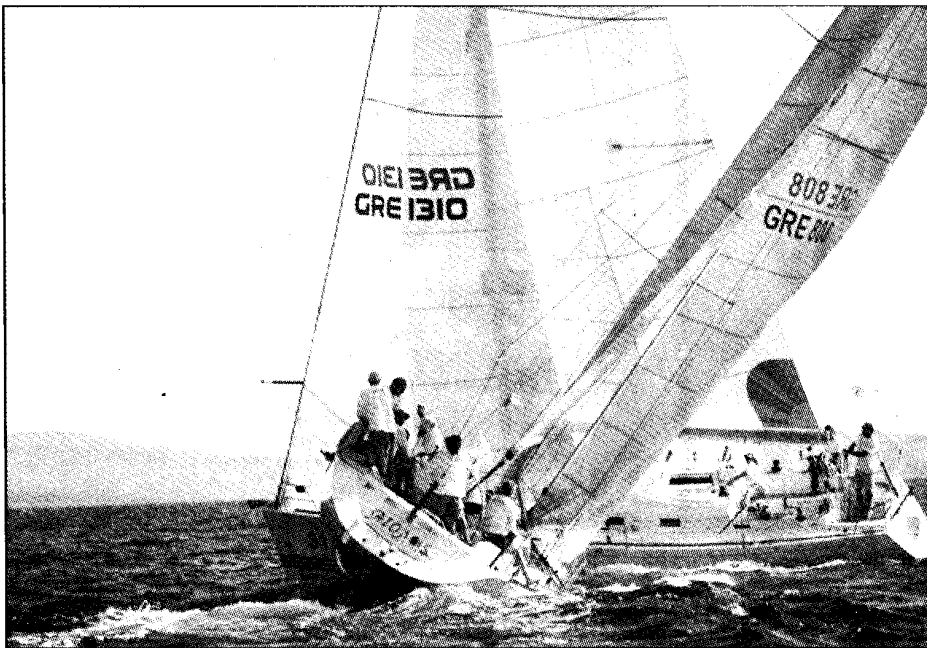
« ΑΙΟΛΟΣ » κατά προέδρου ΝΟΑΘ Βύρωνα Μπέλλου. Στον αγώνα δεν υπάρχουν τίτλοι και οι εμβολισμοί είναι μέσα στο παιχνίδι